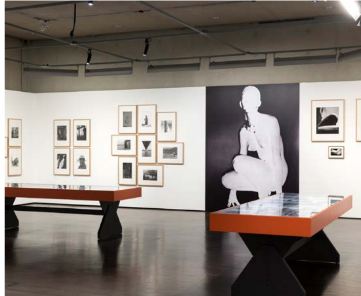
Exposition Romain Urhausen

Le CNA collabore avec des institutions et des galeries nationales et internationales afin de promouvoir ses collections. Il s'agit notamment du Casino Forum d'art contemporain Luxembourg, du Cercle Cité, du Musée national d'histoire naturelle, de la Villa Vauban, du Luxembourg Center for Architecture et des Centres d'Art Dudelange. Le CNA ouvre également ses galeries pour exposer des collections d'autres institutions telles que le Musée de l'Elysée, FoMu Anvers, SK Stiftung für Kultur Cologne, MACBA, Magnum Photos, Lee Miller Archive.