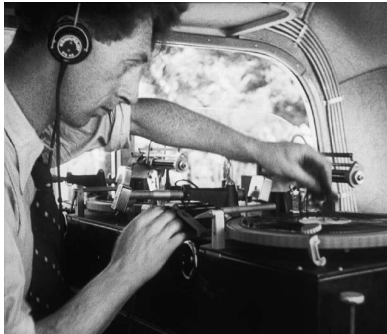
Radio Luxembourg, antenne de l'Occident (Jean Benoit-Levy, 1937).

En font partie, par exemple, les enregistrements audio de l'Orchestre philharmonique du Luxembourg.