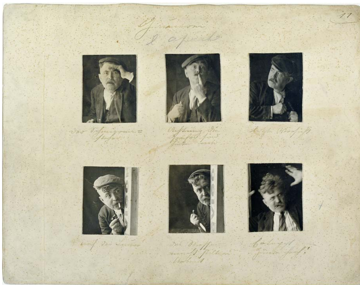
Expressions, Epreuve argentique au gélatino-bromure d'argent sur papier baryté © Henri Hübsch / HISAAF000053J01, Fonds HISAAF Henri Hübsch (Collection du CNA).

Le comité de pilotage du Pôle Archives du CNA est chargé de veiller à ce que les décisions d'acquisition soient conformes à la politique de collecte et à la politique de sélection. Si nécessaire, les acquisitions potentielles sont soumises pour analyse au personnel spécialisé ou à des intervenants externes (p. ex. pour garantir que le CNA sera en mesure d'en assurer le catalogage, l'accès et la préservation).