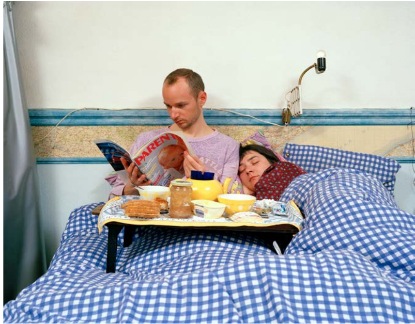
Sans titre, Série 'Les dimanches', Tirage chromogène d'après négatif couleur contrecollé sur aluminium, Collection Lauréats Mosaïque (Collection du CNA).