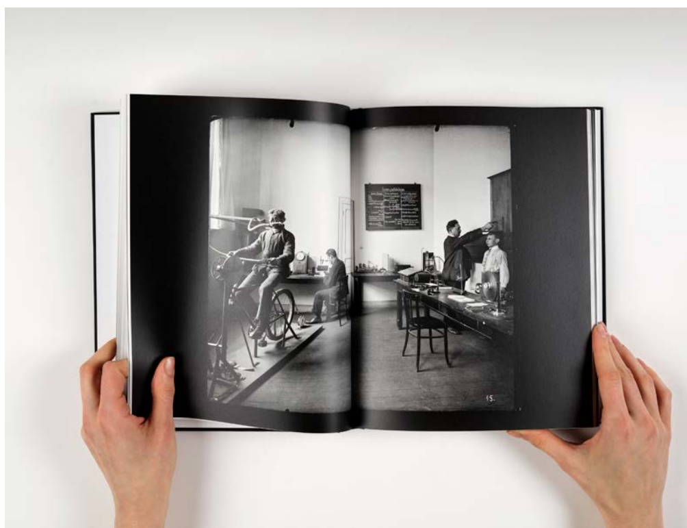
Publication 'La Forge d'une société moderne'