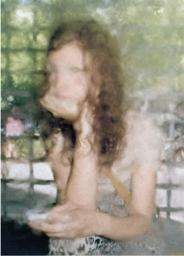
Sans titre, Série 'Coexistence', Impression Ink Jet © Stephen Gill / CDEABE000045 Collection Commande (Collection du CNA).