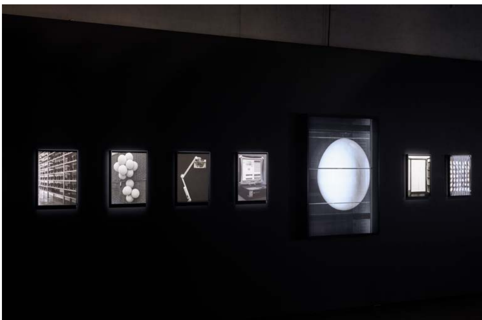
Exposition 'NEOs' de Ezio D'Agostino, © Romain Girtgen CNA

Le contenu du CNA est mis à disposition pour être réutilisé dans différents contextes.