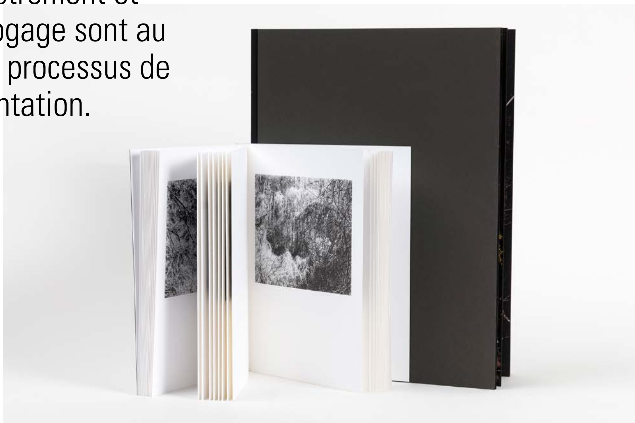
Livre 'Perigee' de Paul Gaffney, © Romain Girtgen, CNA

Le processus d'enregistrement commence lorsque le matériel entre la première fois dans les archives et donne lieu à la collecte d'un ensemble minimal d'informations. Une fois le processus d'acquisition terminé, une analyse plus approfondie du matériel suit. Il s'agit de décrire (entre autres) le contenu intellectuel du matériel (date, sujets, lieux, intervenants, etc.) et les caractéristiques physiques et/ou techniques (format de diffusion, dimensions, procédés photographiques, composants, etc.). Ce niveau de catalogage permet d'exploiter le matériel, de le retrouver plus facilement dans un catalogue et de communiquer à son sujet. Des informations administratives, telles que la provenance, l'état et les droits associés aux documents sont également enregistrées.