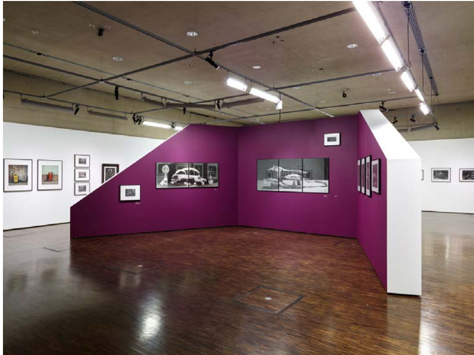
Exposition Michel Medinger, © Romain Girtgen, CNA