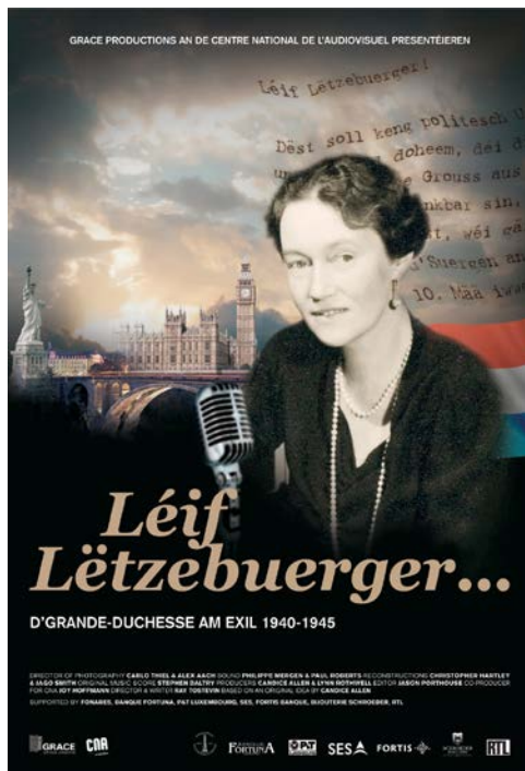
Léif Lëtzebuerger (Ray Tostevin, 2008)

Cette collection regroupe des enregistrements de pièces de théâtre et de concerts qui témoignent de la vie artistique au Luxembourg. Techniquement, ils sont souvent de mauvaise qualité, mais ils sont importants dans la mesure où ils reflètent toute la variété des événements culturels au Luxembourg.