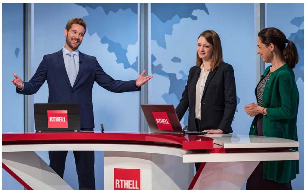
Superjhemp (Felix Koch, 2018)

Près de 800 téléchansons datant des années 1950 et 1960, dont la plupart ont été interprétées par les stars de la chanson française, ainsi que de nombreux clips vidéo des années 1980.