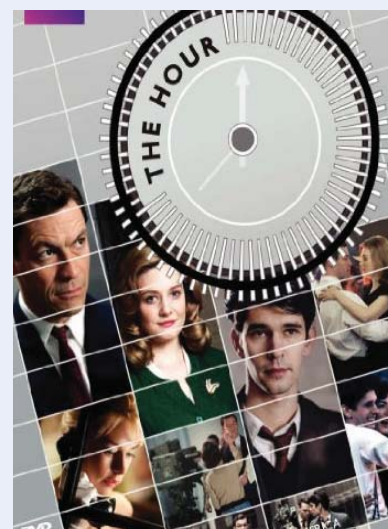
The Hour season 1