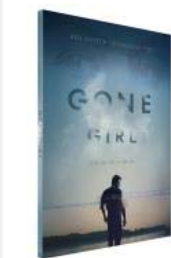
Gone Girl David Fincher