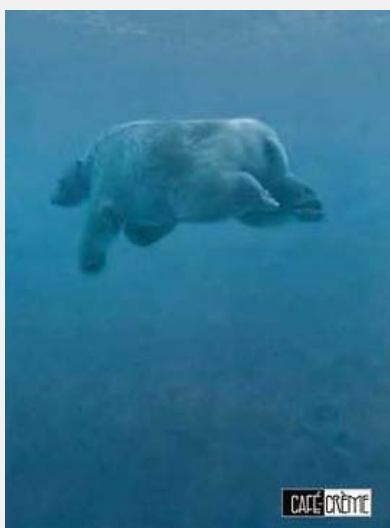
Café-crème 21.31 STlc