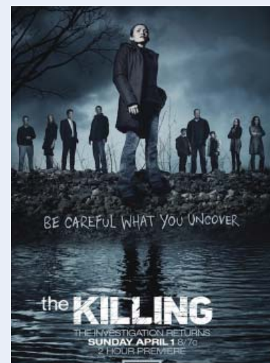
The Killing Veena Sud