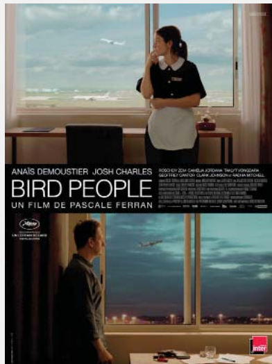
Bird People Pascale Ferran