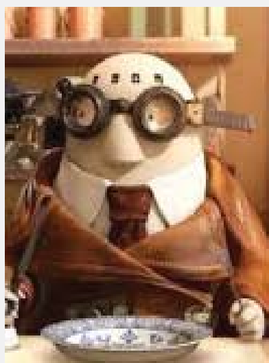
CINÉ-GOÛTER : MR HUBLOT, ROSE ET VIOLETTE, LA CHOSE PERDUE 29 /01/2015