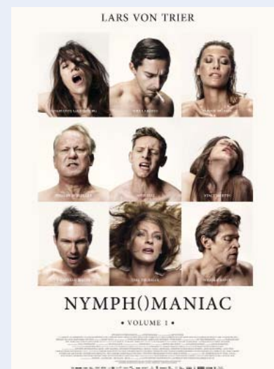
Nymphomaniac Lars Von Trier