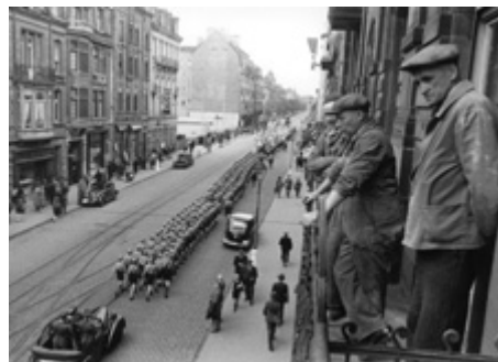
Avenue de la Liberté (31 mai 1941) photo: Tony Krier

© Photothèque de la Ville de Luxembourg © Photothèque de la Ville de Luxembourg