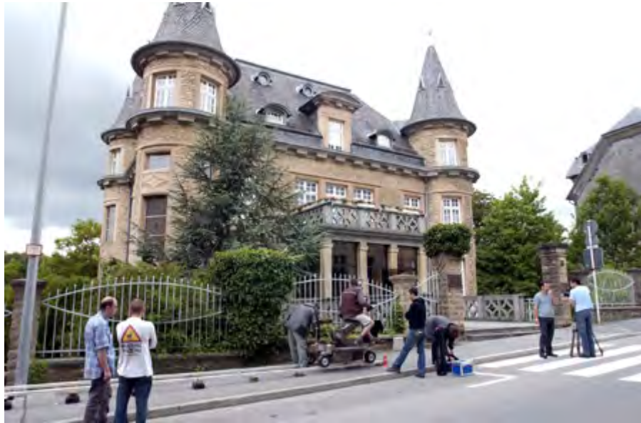
Tournage devant la Villa Pauly