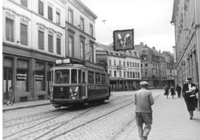
Avenue de la Porte Neuve (+/- 1941); photo: Tony Krier © Photothèque de la Ville de Luxembourg

L'invasion du Grand-Duché de Luxembourg par l'armée allemande en 1940 signifie pour le peuple luxembourgeois le début d'un long calvaire. Pendant plus de 4 ans, le pays se retrouve occupé par les nazis qui veulent détruire l'indépendance luxembourgeoise et intégrer le Grand-Duché au Reich allemand.