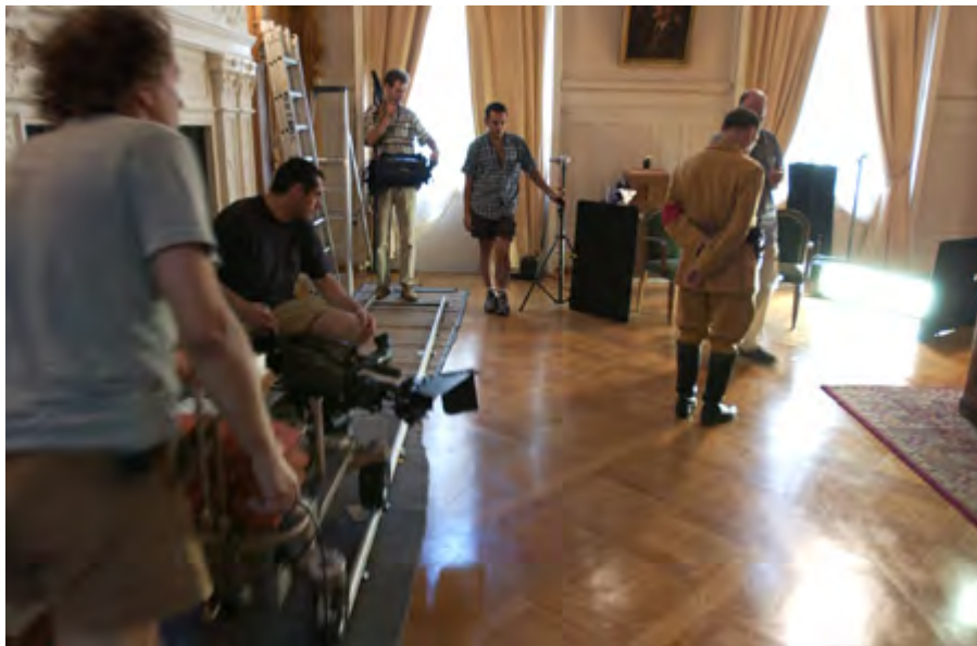
Tournage au Cercle municipal

en préparation: la rationalisation de l'industrie lourde dans l'entre-deux-guerres (article), le Parti Chrétien Social entre 1979 et 2004 (article)