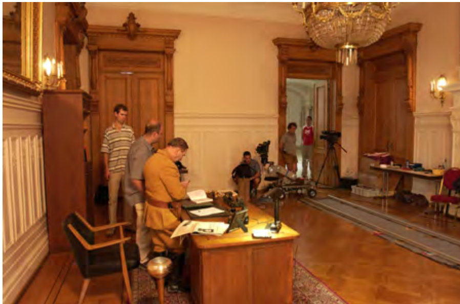
Le bureau du Gauleiter (qui se trouvait dans le bâtiment de l'Arbed) a été reconstitué dans une pièce du Cercle municipal

1999 : composition de la bande originale de Une liaison pornographique (Réal: : Frédéric Fonteyne) - 1999 : composition d'un ballet pour le spectacle Mir maachen d'Bréck de Jemp Schuster - 2000 : composition de la bande originale du spectacle multimédia Liichtjoren produit par le Centre national de l'audiovisuel - 2001 : musique pour un spot de l'Armée luxembourgeoise - 2002 : musique du film de présentation du Grand-Duché à l'occasion du grand départ du Tour de France à Luxembourg - 2002-2003 : Musique pour les documentaires d'archives Les funérailles d'Emile Mayrisch (1928) et Contrôle du marché (1938) – composition de la bande originale de Heim ins Reich (Réal: : Claude Lahr) - 2004 : composition de la bande originale de René Deltgen, der sanfte Rebell (Réal: : Michael Wenk)