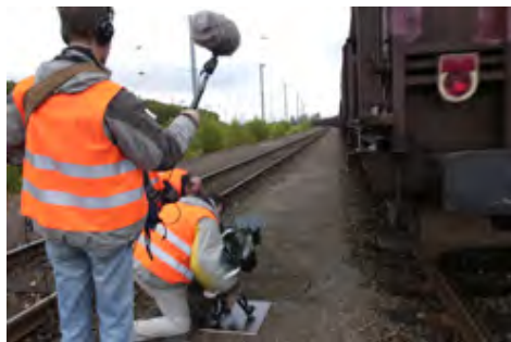
Tournage du film Heim ins Reich

Etudes supérieures à l'Institut des Arts de la diffusion (IAD) à Louvain.