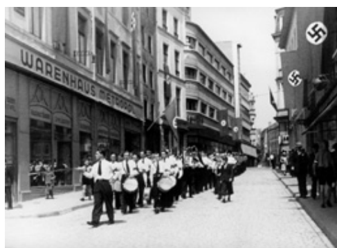
Défilé allemand rue du Fossé 1941

Le 10 octobre 1941, le chef de la "Zivilverwaltung" décide d'entreprendre une "Personenbestandsaufnahme", un recensement racial qui contient, entre autres, trois questions insidieuses sur la langue maternelle ("Muttersprache"), l'appartenance ethnique ("Volkstumszugehörigkeit") et la nationalité ("Staatsangehörigkeit"). Les Allemands font passer le message que les Luxembourgeois doivent y répondre à chaque fois par "alleman". La résistance lance des appels à la population pour l'inciter à répondre "lëtzebuergesch" aux trois questions. Soupçonneux, les Allemands prélèvent des échantillons au hasard la veille du dépouillement. Constatant qu'une écrasante majorité des Luxembourgeois a en effet répondu par "lëtzebuergesch" aux trois questions incriminées, ils annulent le recensement.