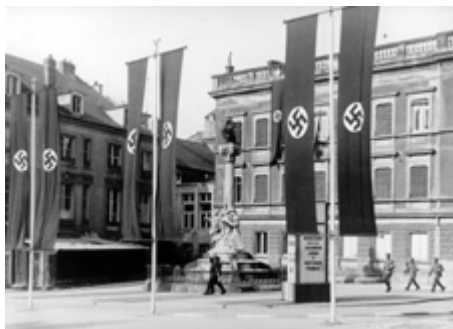
Place d'Armes (1942)

De l'autre côté, une poignée d'hommes et de femmes a fait un choix qui force le respect et qui ne va pas de soi: celui de se livrer à des actes de résistance afin de stimuler l'esprit d'opposition du peuple luxembourgeois.