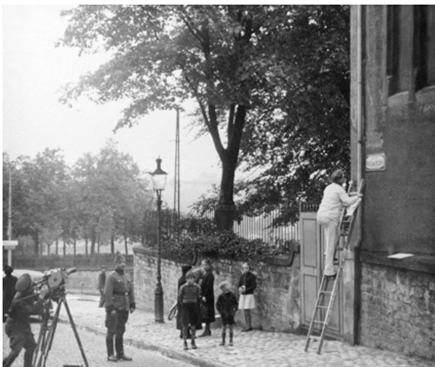
Une rue change de nom; un soldat allemand filme la scène