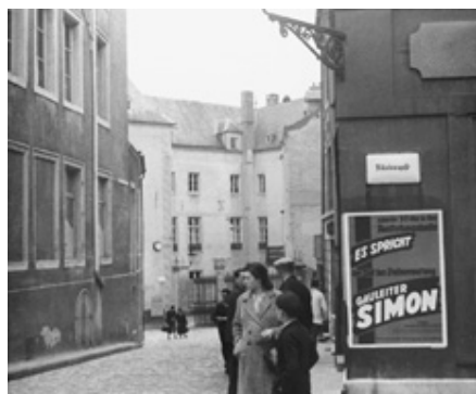
Rue de l'Eau (1941?)