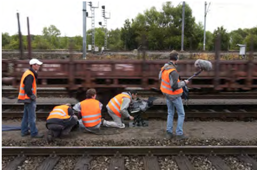
Tournage du film Heim ins Reich