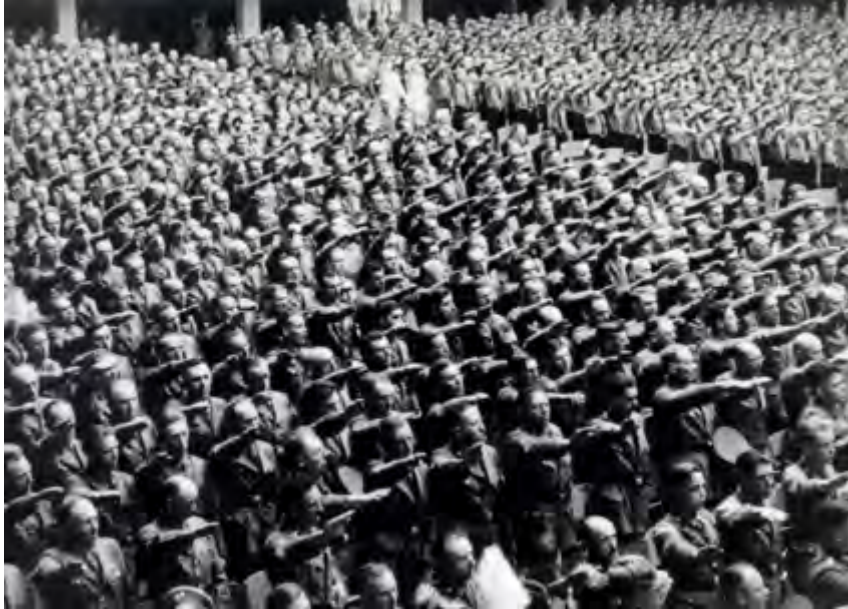
Grosskundgebung au Limpertsberg

A travers de nombreux témoignages et documents d'archives, Heim ins Reich nous fait revivre ces années noires lors desquelles les croix gammées décoraient les rues du Grand-Duché. Les témoins sont des Luxembourgeois impliqués personnellement et de manière directe dans les événements qu'ils racontent.