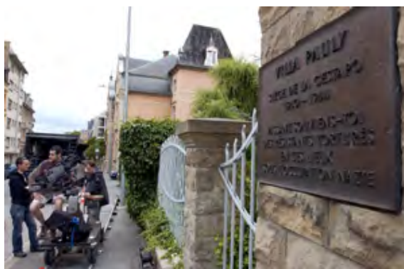
Tournage devant la plaque commémorative de la Villa Pauly